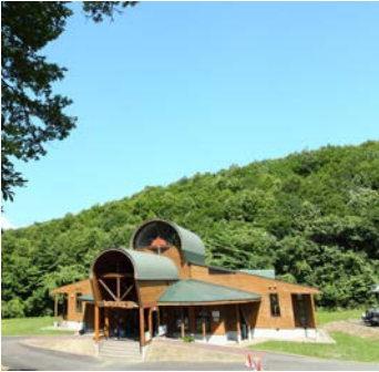
"くろもり館" BioBlitz 本部となります。調査活動範囲は赤線で示した範囲です。

「白神の森遊山道」は鱒ヶ沢町中心部の南、およそ 12 km の白神山地（黒森地区）に位置しています。世界自然遺産地域からは離れていますが、この地域は江戸時代から地元の田畑を潤す水を確保するために地元の人々によって守られてきた水源の森です。約 52ha の森林が長年にわたり、伐採されることなく守られてきました。林内にはミズナラやブナの大木が残り、世界遺産地域の核心地域と同様の自然を楽しむことができます。